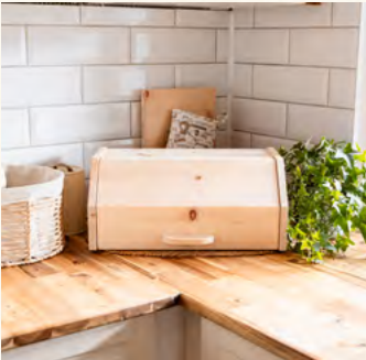
ZirbenBrotdose "klassisch groß" mit Deckel Brotdose + Ablagegitter

Maße Länge: 350mm Breite: 280mm Höhe: 200mm