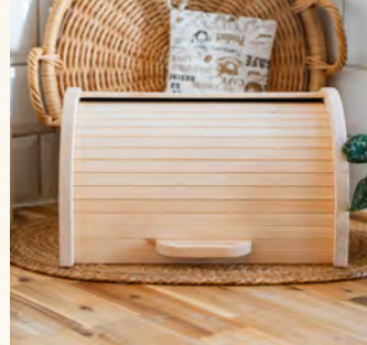
ZirbenBrotdose "elegant" mit Rollo Brotdose + Ablagegitter

Maße Länge: 450mm Breite: 280mm Höhe: 200mm