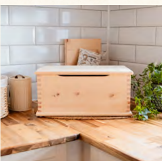
ZirbenBrotkiste Brotdose + Deckel + Ablagegitter

Maße Länge: 310mm Breite: 220mm Höhe: 180mm