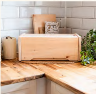
ZirbenBrotkasten Brotkasten + Ablagegitter

Maße Länge: 350mm Breite: 280mm Höhe: 200mm