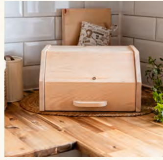
ZirbenBrotdose "klassisch klein" mit Deckel Brotdose + Ablagegitter

Maße Länge: 450mm Breite: 280mm Höhe: 200mm