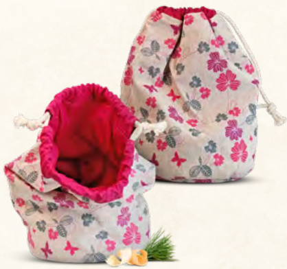
Zirbenbrotbeutel "Schmetterling & Blümchen" aus Leinen

Maße: ca. 32cm hoch Durchmesser: 19cm perfekt zur Brotaufbewahrung von 2-6 Brötchen