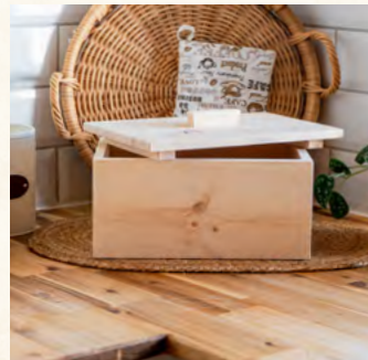
Zirbenbrotkiste "KOMPAKT" Brotdose + Deckel mit Griff

Maße Länge: 450mm Breite: 250mm Höhe: 180mm