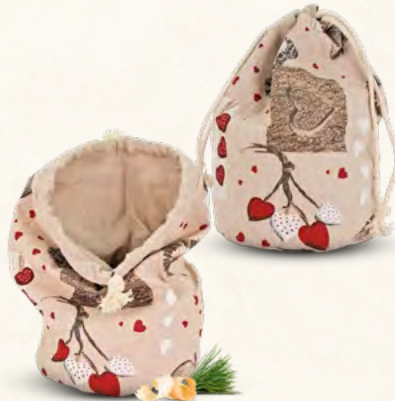
Zirbenbrotbeutel "Tracht" aus Baumwolle

Maße: ca. 32cm hoch Durchmesser: 19cm perfekt zur Brotaufbewahrung von 2-6 Brötchen