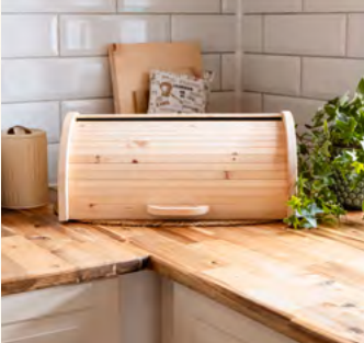
ZirbenBrotdose "elegant" mit Rollo Brotdose + Ablagegitter

Maße Länge: 450mm Breite: 280mm Höhe: 200mm