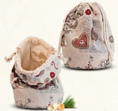
Zirbenbrotbeutel "Landhaus" aus Baumwolle

Maße: ca. 32cm hoch Durchmesser 19cm perfekt zur Brotaufbewahrung von 2-6 Brötchen